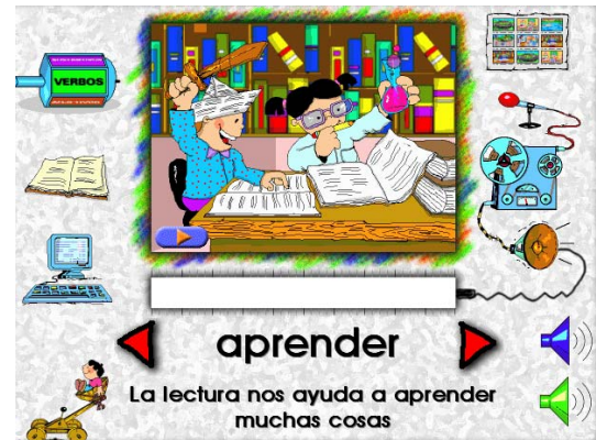
Figura 2. Menú del programa “ABCLandia, Entorno Multimedial para el desarrollo de habilidades Comunicativas”